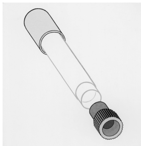
Muestreador pasivo para el dióxido de nitrógeno

El muestreador pasivo es apropiado también para determinar la exposición personal al dióxido de nitrógeno.