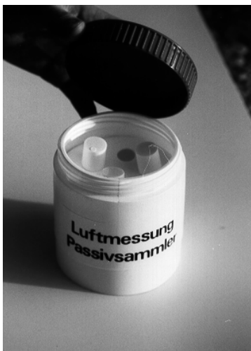
Dispositivo de protección contra la influencia del tiempo

El muestreador está basado en el principio de difusión molecular de dióxido de nitrógeno hacia un medio absorbente, en este caso de trietanolamina. El muestreador consiste en un tubo de polipropileno de 7.4 cm de largo y de 9.5 mm de diámetro interno [1]. Los muestreadores se colocan en un dispositivo especial, para protegerlos de la lluvia y minimizar la influencia del viento.